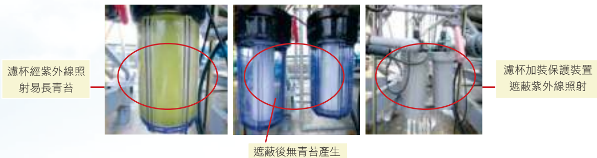
圖四 濾杯長期暴露室外