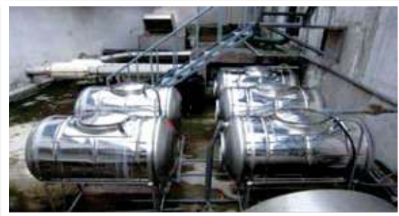
圖三 空調冷卻水回收儲存桶

在回收過程中發現一些問題，如：監測水質的濾杯及漏斗長期暴露於室外，經紫外線照射後較易長青苔、異物易堵塞，管路內未飽管以致回收水無法正常供應廁