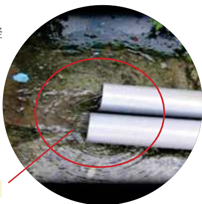
圖一 監測水直接排放

99年6月~100年4月，水錶記錄共排放了3,876噸的水源，以每噸自來水17元估算，即浪費了65,892元，在節能減碳的推動下，本院管理單位積極擬定排放之水回收再利用改善對策。（如圖一）